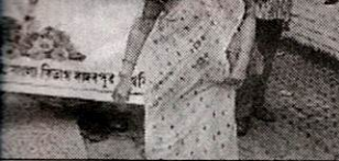
Alumni Association of JU

► Send phones of the accused to forensic experts. Will decipher if anything has been deleted and WhatsApp calls made immediately after